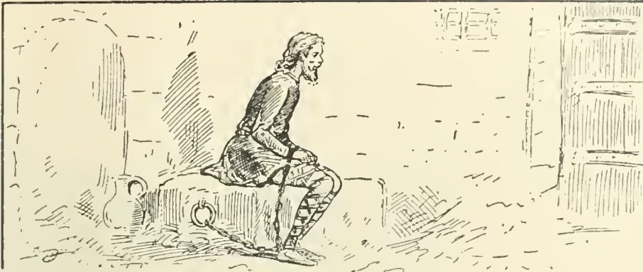
Il fut saisi et mis aux fers. (page 140)